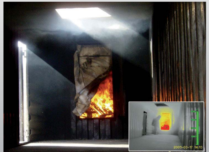
Der mobile Rauchverschluss im Brandversuch