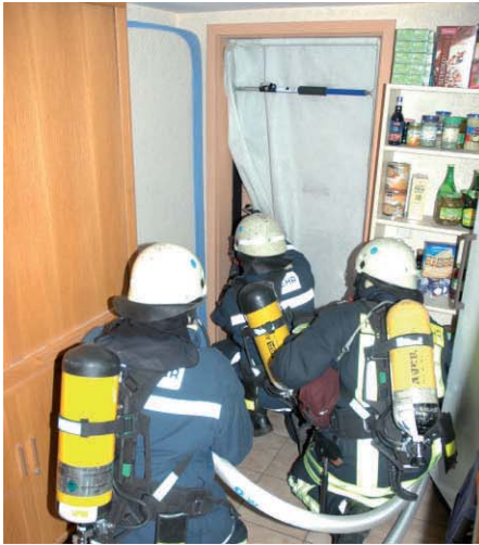
Einsatz des mobilen Rauchverschlusses bei einem Kellerbrand