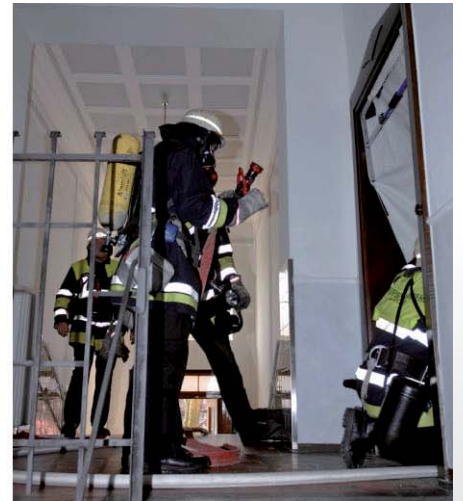
Einsatz des mobilen Rauchverschlusses bei einem Wohnungsbrand